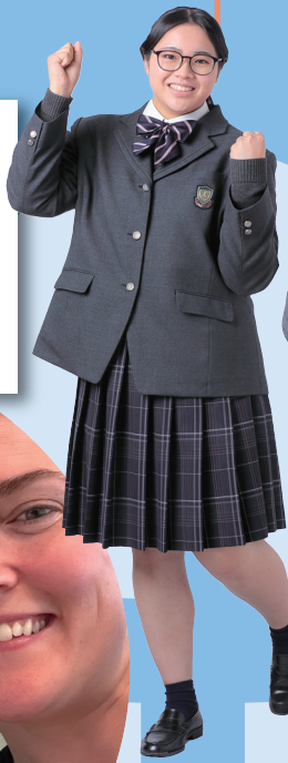
◀ホームステイでお世話になったホストファミリーとの一枚。