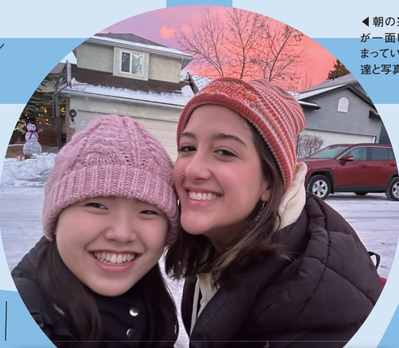
◀朝の通学途中、空が一面ピンク色に染まっていた、思わず友達と写真を撮りました!

カナダという異国で言葉、文化、生活を学ぶ事は、多感な時期の娘にとって何事にも替え難い経験だったと思います。留学後には国際的な感覚を身につけた我が子に頼もしさを感じると共に、きっと大変な思いをしたからこそその成長ののだなど実感しています。